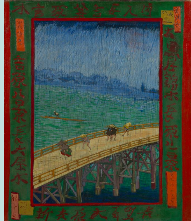
Vincent van Gogh, Brug in de regen (naar Hiroshige) , 1887