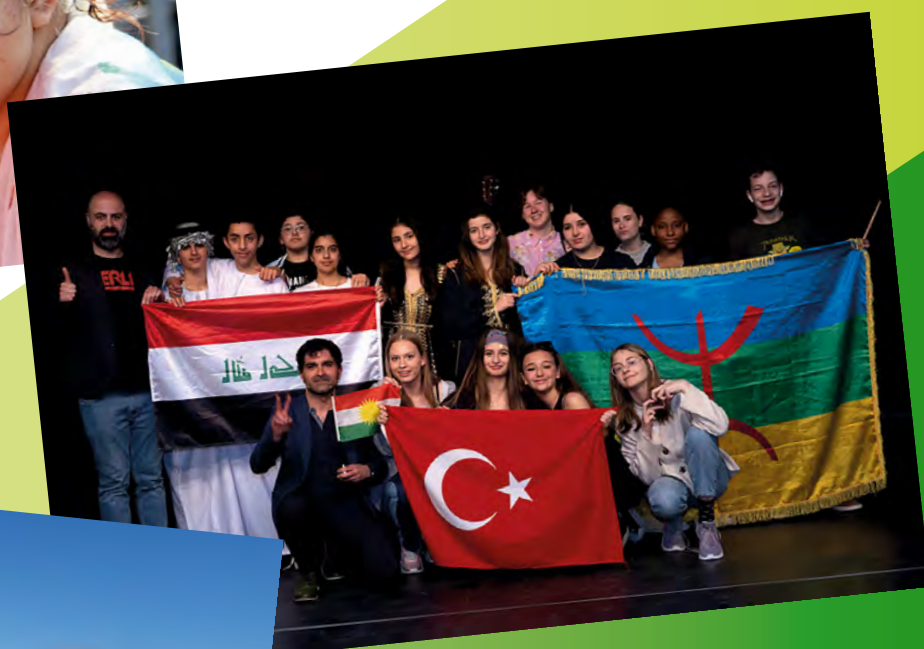
Themaviering 'Share your culture'