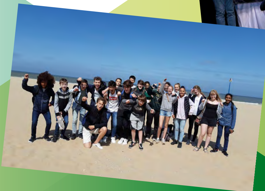
Uitwisseling klas 2 met Duitsland en Denemarken