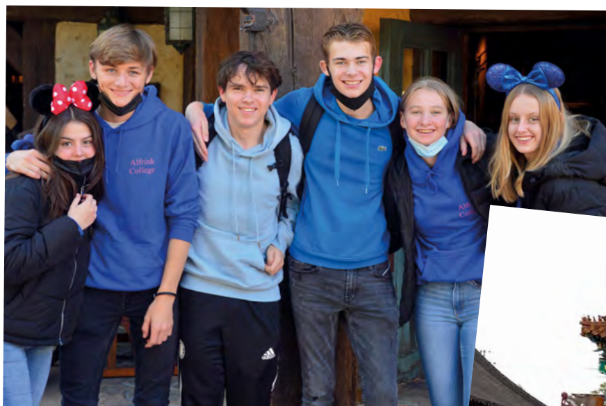
Eindexamenreis naar Disneyland Parijs

Kiezen voor het Alfrink College betekent ook: kiezen voor mooie en bijzondere excursies!