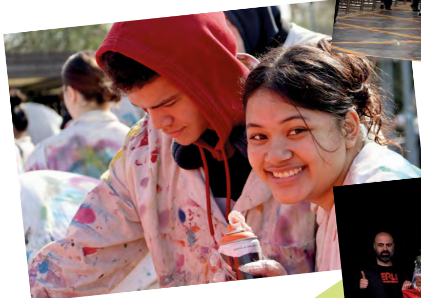
Inzamelingsactie voor Oekraïne